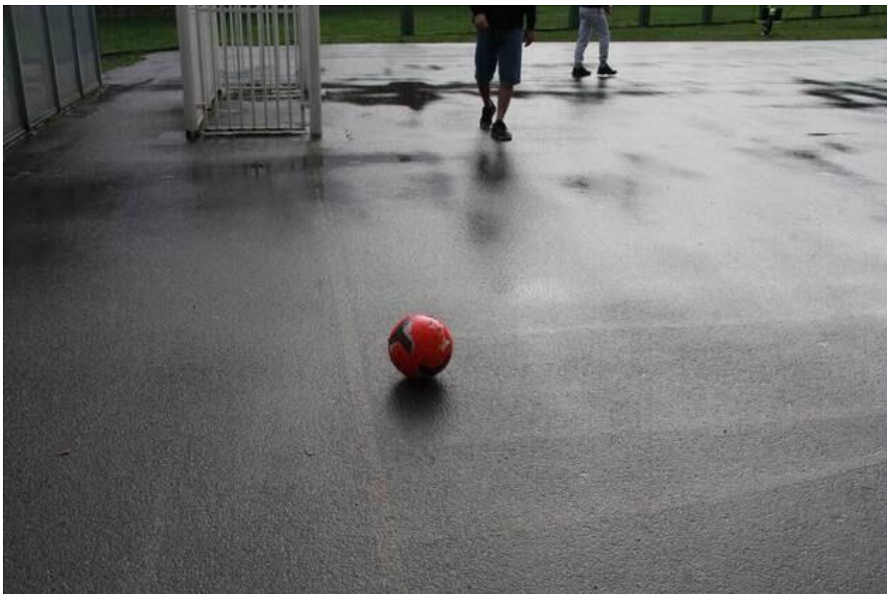
Sur le terrain, des détenus jouent au foot.

La poignée de détenus qui en a bénéficié lui en est reconnaissante. Du temps en famille, ce sont des bribes de vie précieuses pour se reconstruire.