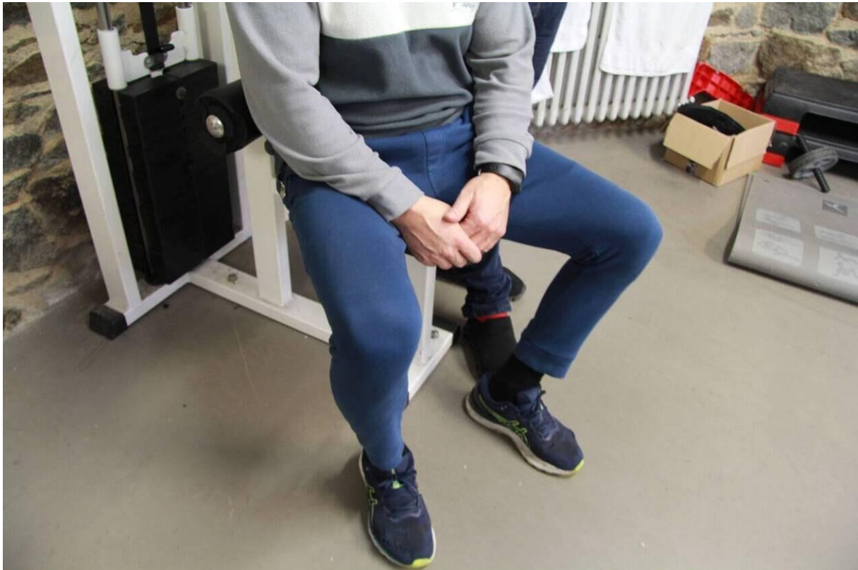
Séquence musculation pour ce détenu

Pratiquer le sport à la maison d'arrêt, c'est un choix. Une centaine l'a fait. « Des gros sportifs viennent tous les jours », note Claire Burban, qui jongle avec la composition des groupes. Embrouilles de personnes, décisions du tribunal... Certains détenus ne doivent pas se croiser. Il faut composer avec ces paramètres.