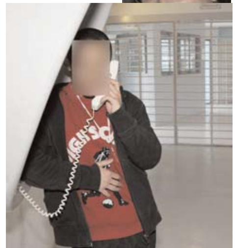
Prisoner making a phone call (prison of Meaux-Chauconin)