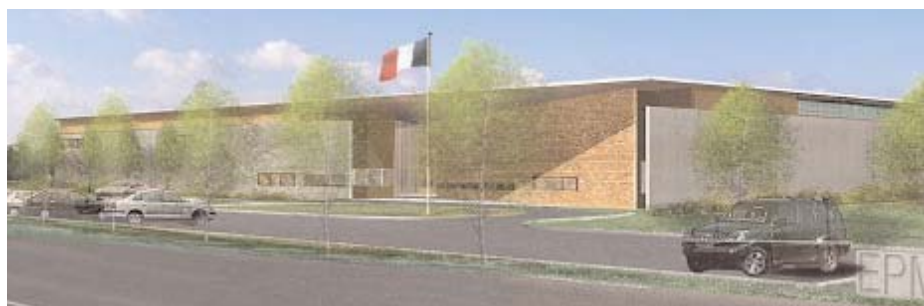
L'EPM du Rhône a ouvert le 13 juin 2007

Si dans les établissements pour peine, les détenus avaient déjà un accès contrôlé au téléphone, ce n'était pas le cas des personnes condamnées en MA. À compter d'octobre - novembre 2007, des cabines téléphoniques seront instal-