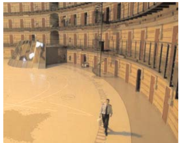
Prison de Arnhem aux Pays-Bas

Le magistrat en charge du dossier peut prévoir certaines limitations pour les visites. Toutefois, en général les détenus ont droit à une heure de visite par semaine.