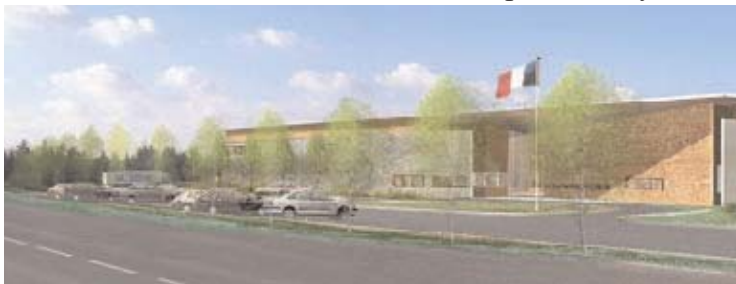
The Rhône juvenile offender institution opened on 13 June 2007

Although prisoners in penitentiary centres already had controlled access to telephones, remand prisoners did not. From October and November 2007, telephone booths will be installed in the remand prisons in Bois-d’Arcy and Villefranche, in the penitentiary centre