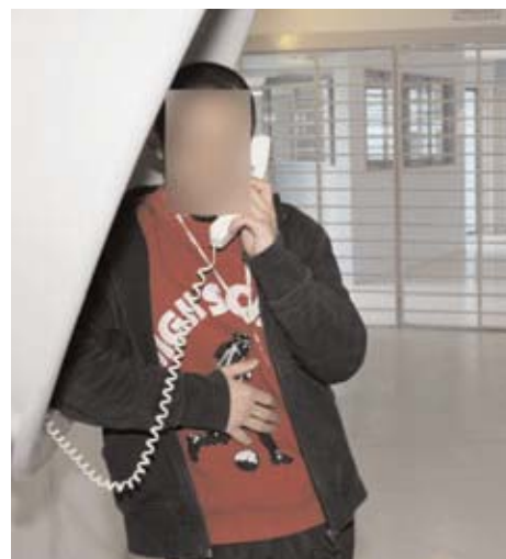
Cabine téléphonique au centre pénitentiaire de Meaux-Chauconin