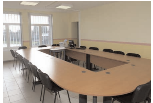
Maison d'arrêt de Douai - salle rénovée et destinée à la commission pluridisciplinaire unique.