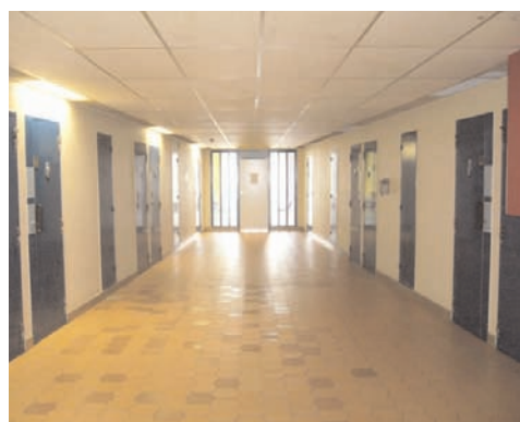
Centre pénitentiaire de Metz - quartier arrivant rénové en 2007- candidat à la labellisation en 2009.

Chaque nouveau site est mis en service en conformité avec les RPE et fera l'objet, dans l'année suivant son ouverture, d'une évaluation aux fins d'être labellisé.